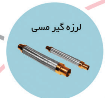
لرزه گیر مسی