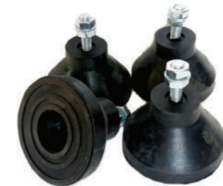
پایه لرزه گیر